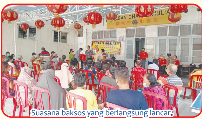
Suasana baksos yang berlangsung lancar.