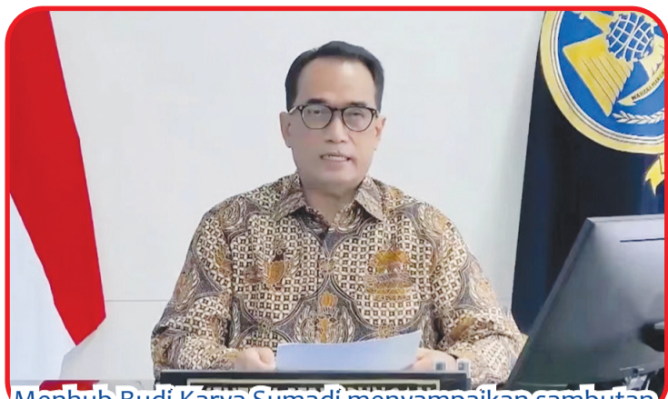
Menhub Budi Karya Sumadi menyampaikan sambutan.