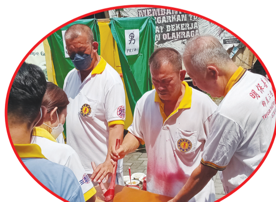
Prosesi Puja Pudu mengikuti instruksi dari guru.

Puja Pudu juga diselenggarakan di Jakarta, Bandung dan berbagai daerah lainnya. • idn/din