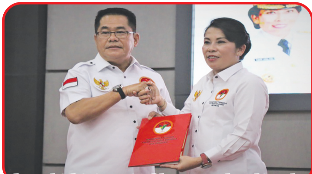
Wali Kota Tjhai Chui Mie menerima dokumen pengangkatan dirinya sebagai Dewan Pengarah PTK Indonesia dari perwakilan PTK Indonesia.

Beberapa pembangunan infrastruktur yang sedang dikerjakan hingga akhir masa jabatannya nanti antara lain pembangunan Bandara Singkawang, pembangunan Masjid Agung Singkawang serta pembangunan 3 Gerbang Batas Kota Singkawang. • idn/din