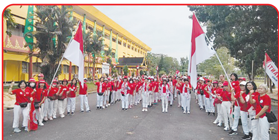
JALAN SANTAI: Kegiatan jalan santai yang diselenggarakan Perwanti dan PSMTI Riau.

PEKANBARU (IM) - Sebanyak 350 orang warga mengikuti kegiatan jalan santai yang diselenggarakan Persaudaraan Wanita Tionghoa Indonesia (Perwanti) Riau dan Paguyuban Sosial Marga Tionghoa Indonesia (PSMTI) Riau.