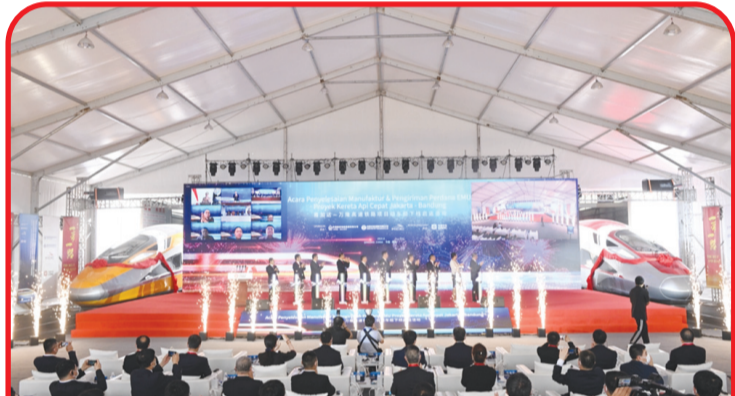
Kegiatan offline Penyelesaian Manufaktur & Pengiriman Perdana EMU Proyek Kereta Cepat Jakarta - Bandung.

Sedangkan bagi Indonesia, juga akan menjadi negara pertama di Asia Tenggara yang memiliki moda transportasi kereta api berkecepatan tinggi. • idn/din