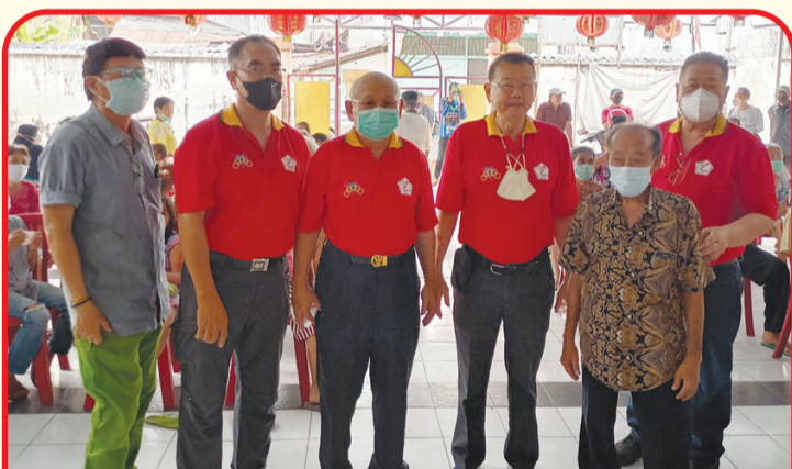
Pengurus foto bersama warga.

SURABAYA (IM) - Yayasan Senopati bersama Komunitas Sosial Masyarakat Tionghoa Surabaya membagikan 100 paket beras di Yayasan Dharma Mulia, Jalan Tambak Bayan, Surabaya, Minggu (7/8).