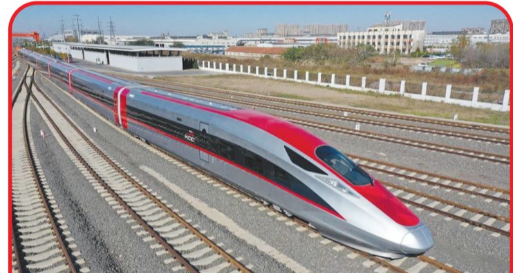
EMU Kereta Cepat Jakarta Bandung di Qingdao.