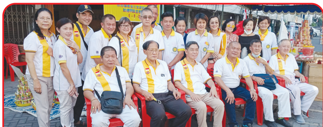
Pengurus Yayasan Sosial Bhakti Moral De Jiao Hui Ming Bao Shan Ge Semarang berfoto bersama.

Acara tahun ini memperoleh bantuan dan bimbingan dari rekan Persatuan