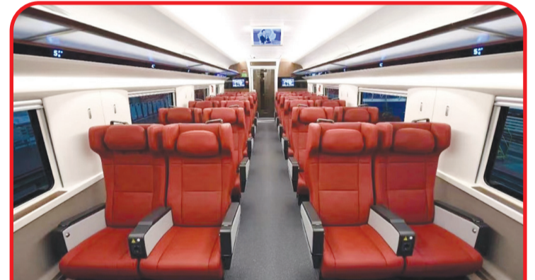
Penampakan Interior EMU Kereta Cepat Jakarta - Bandung yang akan diserahkan ke Indonesia.