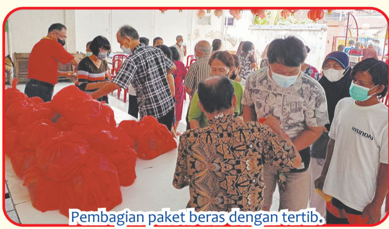
Pembagian paket beras dengan tertib.

"Kegiatan ini rutin kami selenggarakan, sebagai bentuk kepedulian kepada masyarakat pra sejahtera," imbuh Chandra Wurianto Woo didampingi pengurus Anies Rungkat Tjokro Pontjoharyo dan Djunaidi.