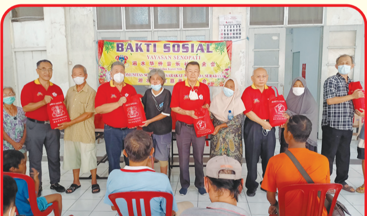
Pemberian paket beras.